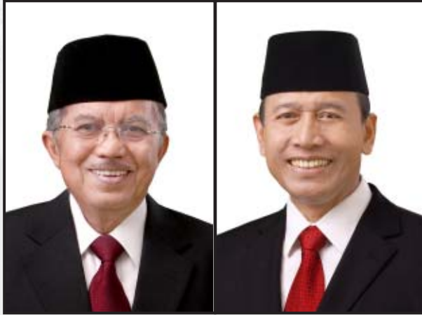
Drs. H. M. Jusuf Kalla