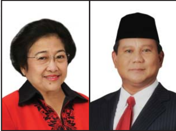
Hj. Megawati Soekarnoputri