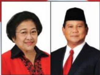
Hj. Megawati Soekarnoputri