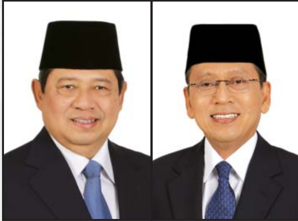
Dr. H. Susilo Bambang Yudhoyono