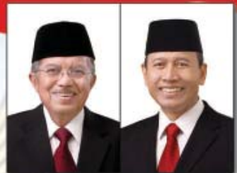
Drs. H. M. Jusuf Kalla