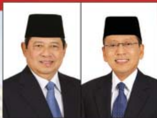
Dr. H. Susilo Bambang Yudhoyono